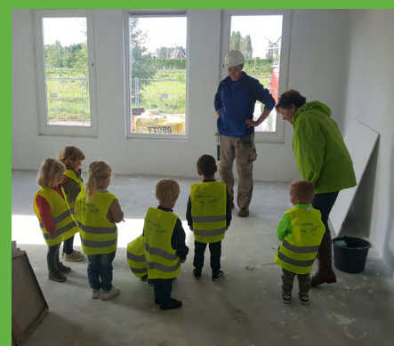
Jeugdige bouwbezoekers in Zevenaar