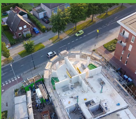
Appartementen De Groene Hoven - Apeldoorn