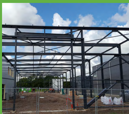
Bouwcenter RAB - Femnes